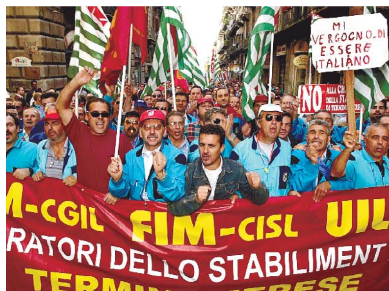
Una manifestazione degli operai di Termini

Il sindaco di Termini Imerese, Salvatore Burrafato, ha così commentato l'esito dell'incontro: «A noi interessa un accordo complessivo che porti al reimpiego dei lavoratori della Fiat e dell'indotto in un progetto che dia garanzie sia sotto il profilo industriale ma che abbia anche la sostenibilità finanziaria per accedere agli incentivi di Invitalia. In questo quadro l'incontro di oggi non poteva essere risolutivo e sollecitiamo con forza un incontro con il ministero dello Sviluppo Economico per avere le dovute rassicurazioni su Grifa».