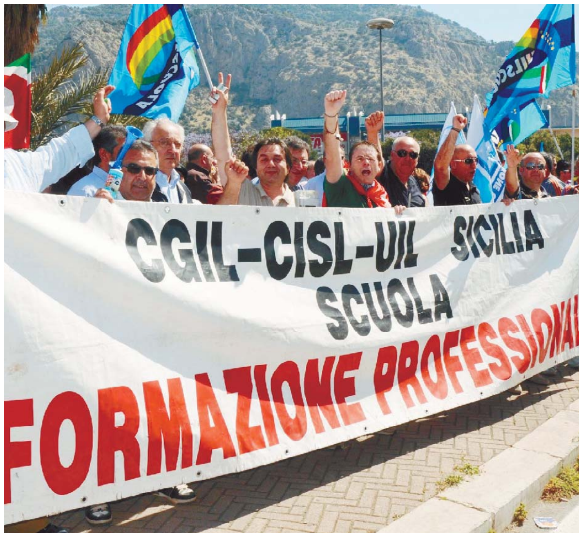
Per mille addetti della Formazione professionale arriva la cassa integrazione

CASO CLICK-DAY. La società: la Corsello vada via. Lo Bello: non accettiamo diktat