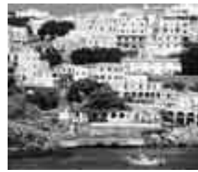
L'ISOLA DI USTICA