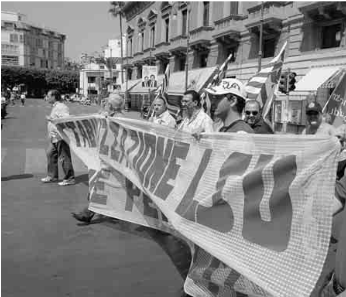
MANIFESTAZIONE DI PROTESTA DEGLI LSU

Di ben più debole tono la reazione del sindaco Leoluca Orlando: «Non è questo il modo di reperire risorse e di contribuire allo sviluppo del Sud. Stiamo parlando di salari a seguito di prestazioni rese. Nell'augurarsi che il governo e la maggioranza in Parlamento confermino il finanziamento, l'amministrazione, in ogni caso, adotterà ogni passo utile perché venga rivista questa posizione». Fortemente preoccupata la Cgil. E fa bene.