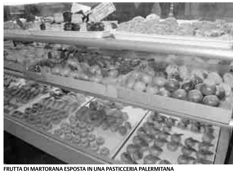
FRUTTA DI MARTORANA ESPOSTA IN UNA PASTICCERIA PALERMITANA