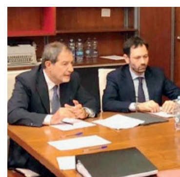
NELLO MUSUMECI E RUGGERO RAZZA

Parole, queste ultime, che suscitano la reazione indignata di Valentina Zafarana, capogruppo del M5S al-